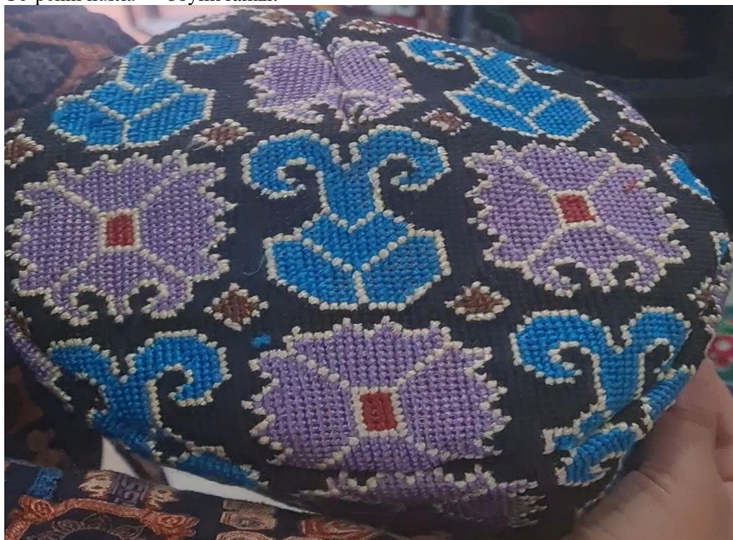
Choparchin nusxa — balo-qazolardan saqlaydi.