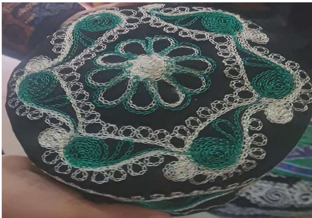
Popop bodom nusxa