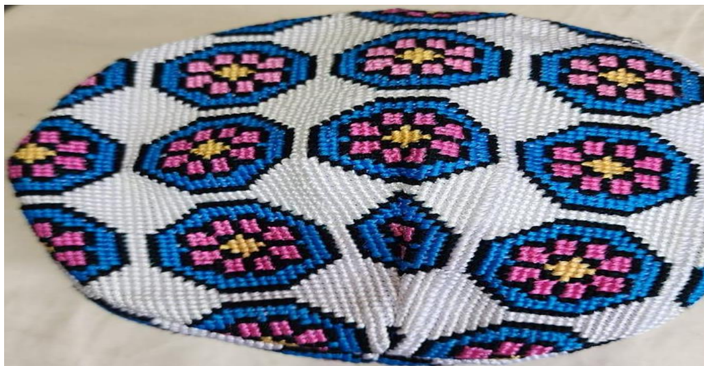
To'pchin nusxa — boylik ramzi.